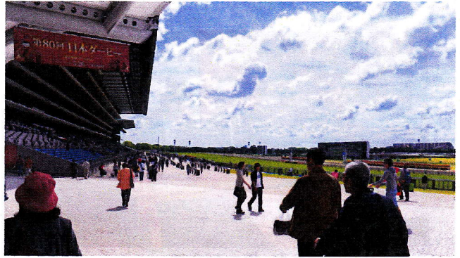
広大な空間東京競馬場

から受けた衝撃と同じ感激でした。競馬場施設も最新のデパートの如く大変きれいで、レストラン、グルメコーナー、遊園地等も有り娯楽設備等も充実されていました。当初、抱いていた競馬場のイメージが一変しました。