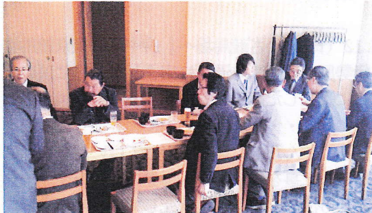
「神奈川放友会の活動を考える“気楽にみんなで 語り合おう”放談会の様子