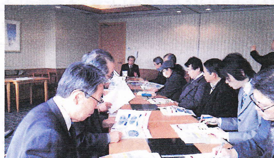
記念講演の資料を見ながら熱心に講演を聞く 出席の皆さま