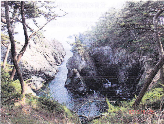
雷岩が見える風景

4枚の写真から想像できると思いますが、断崖絶壁の乱暴岩・波の音が大きい雷岩・海の安全を祈る千代島・岩に穴が開いている穴通磯・うみねこの産卵する島や漁港の赤土倉・観光船の出るえびす浜など、いくら眺めていても飽きることのない、自然美を味わうことが出来ます。是非、足を運んで下さい。・・・碁石海岸へどうぞお越し下さい。三陸沿岸大災害の復興の支援になることでしょう。来訪者の皆さんには、豊かな水産資源と自然美で歓迎致します。写真で碁石海岸の一部を紹介します。