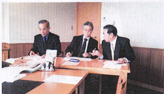
左より実行委員長 橋口副会長 司会村松理事、進行 早瀬理事

和やかな中で活発な意見交換が交わされおり、貴重な時間が有意義に過ごせました。その風景を紹介します。