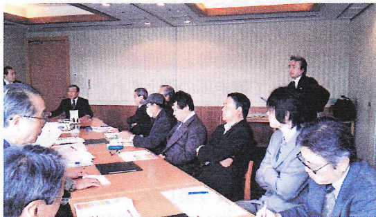
記念講演での質疑が活発に行われた