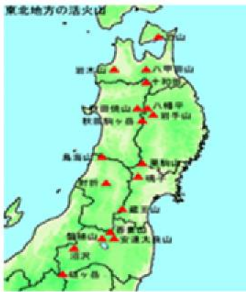
東北大学院理学研究科附属地震 ・噴火予知研究観測センター

を形成する等、大規模な活動が起こっています。今現在、表面上活動が見られないからといって、将来にわたって噴火しないとは決して言えないのです。