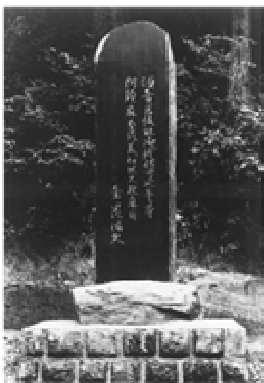
万葉歌碑(黄金神社境内建 立 昭和 29 年 9 月 15 日)

どの報道を信じればよいのか難しい時代である。じっくり考察する時間は大変貴重である。